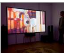
Itse rakennettu kangas toimii hienosti ja säästää rahaa. (TOMI KALLIO)

Äänentoistoon Neuvonen on käyttänyt rahaa kohtalaisesti. Etukaiuttimiin upposi 600 euroa, taakse vajaa 300 euroa kumpaiseenkin ja subbariin 300 euroa. Takakeskikaiuttimen hän osti ystävältään sopuhintaan.